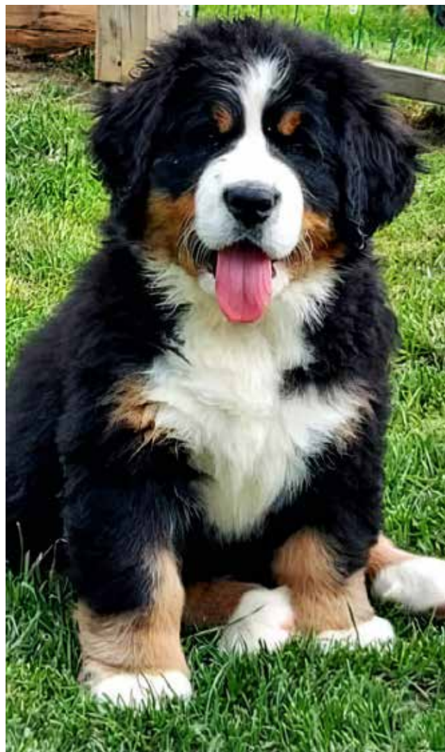
Lord, 8 tednov