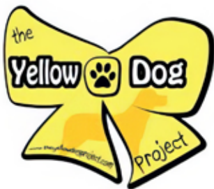
3: logo: www.newyorkcitydog.org