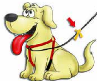
4: yellow dog project 2: www.cotswoldsconnect.com