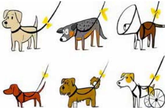
1: razni : www.anvilita.it

Besedilo Karmen Zahariaš, fotografije različni viri