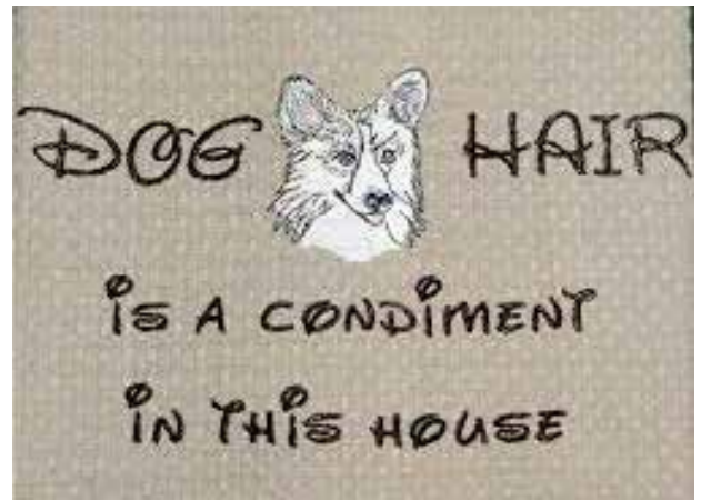
(pasjo dlako imamo pri nas za začimbo)