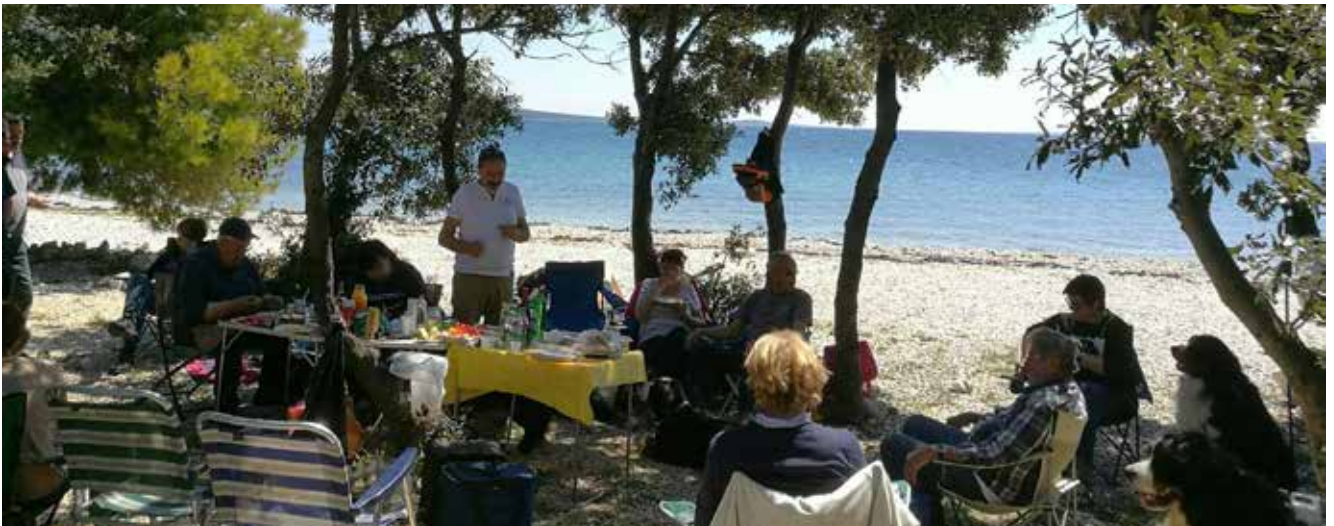
Spomladansko potopevanje po Dalmaciji