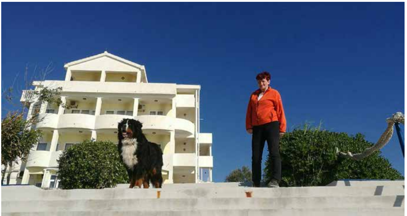
Spomladansko potepanje po Dalmaciji

Glede na raziskavo, opravljeno leta 2005 v ZDA, se omenjena motnja že pojavlja tudi pri bernskih planšarskih psih. Čeprav nimamo podatka, na kako velikem vzorcu je bila raziskava opravljena, je rezultat sledeč: 83 % testiranih berncev je bilo brez genske motnje, 16 % jih je bilo prenašalcev, 1 % pa je dejansko imel bolezensko izraženo motnjo. Izražena genska motnja pomeni, da ima pes dve kopiji mutiranega gena in