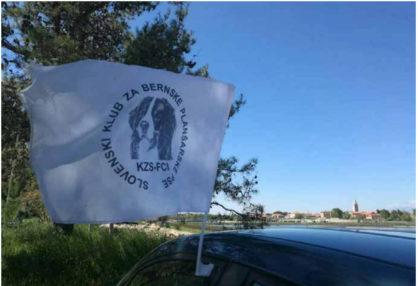
Spomladansko potepanje po Dalmaciji

Da pa ne bomo vedno samo o reševanju že nastalih težav, sva z Manco Černigoj pripravili SEMINAR: Od razposajenega mladička do samozavestnega psa (in zadovoljnega skrbnika!), na katerem se bomo osredotočili na mladičke in mlade pse ter na vse, ki o psu komaj premišljuje. Uvodoma bomo spoznali nekaj temeljnih načel in »želja«, ki jih moramo upoštevati pri izbiri psa, nadaljevali pa z izhodišči, ki jih mora poznati vsak (bodoči) pasji skrbnik: zakaj pes ni volk, kako prepoznati primarne odzive (5F – fight, flight, fool around, freeze), kako ravnati v teh primerih? Pred »vzgojo in šolanjem«, od katere vsi pričakujemo čudeže in rešitve za pogoste težave, moramo v prvi vrsti skrbniki psov poskrbeti za fizično in psihično zdravje psa – poleg klasične oskrbe bomo spoznali tudi nekatere dopolnilne rešitve. Kaj pa moramo upoštevati pri vzgoji, šolanju, zakaj teorija dominance ne drži in kako na psa vpliva že izbira osnovne opreme? Manca je inštruktorica in zagovornica alternativnih pristopov šolanja in vzgoje psov, z bogatim naborom izobraževanj pri nas in v tujini.