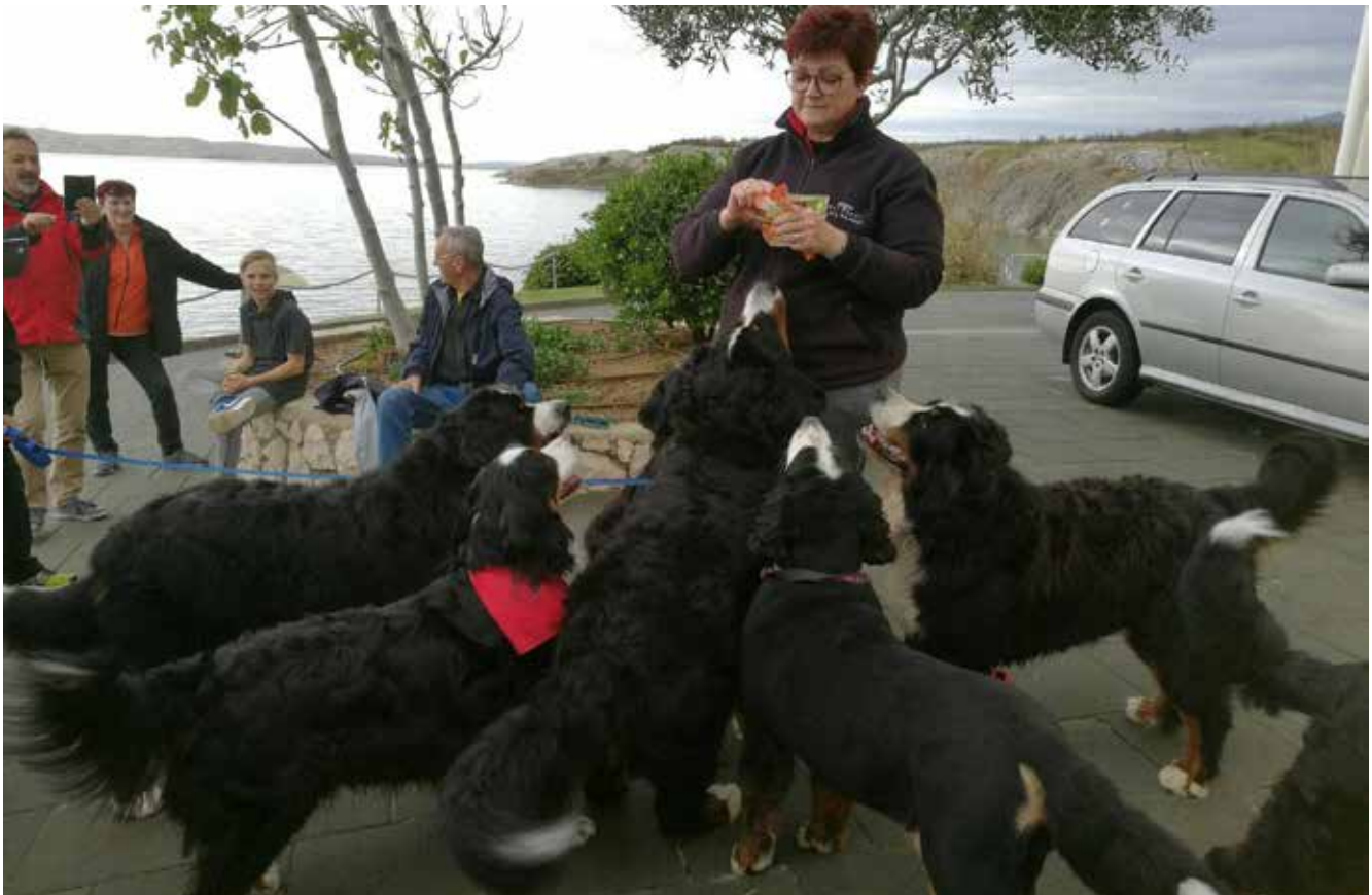
Spomladansko potepanje po Dalmaciji