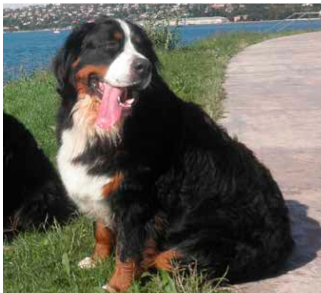
Funny Girl prej