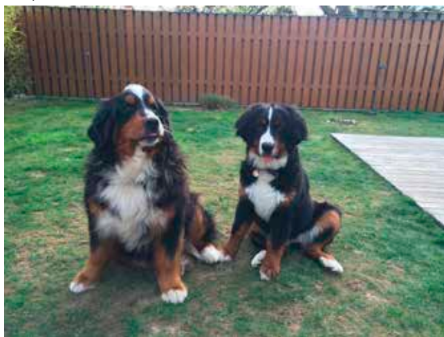
Jilly prej (na sliki levo)