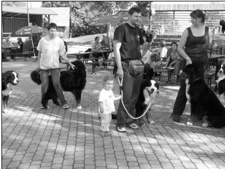
Gremo se pokazati!

Sledilo je ocenjevanje pasje zunanosti, smo šli pokazat Balovo lepo napako v obliki modrega očesa, sodnik pa ni ravno delil mnenja, da je to pa res tako lepo.