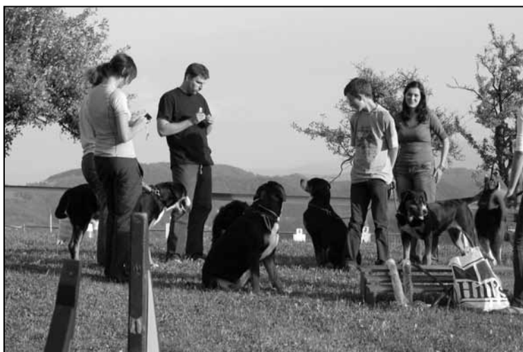
Posvet na RO progi

Končno smo pojedli 2. porcijo palačink, pa malo enolončnice, ko se je že začela predstavitev rally obedience-a, vzporedno pa je bila postavljena proga za agility. Rally Bal že pozna, agility-ja pa ne, pa sta pes in mož malo povadila obe disciplini in bila precej uspešna, seveda, če izzvamemo, da je pes poznal znake za agility, njegov vodnik pa ne. In da je kuža v silni vnemi, da spet dela nekaj novega, na agility progi spregledal eno oviro od dveh.