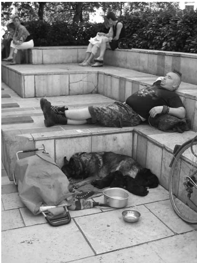
Pasje potepuško poletje v francoskem mestu Besançon

Ker se tudi v Franciji mnoge pasje zgodbe končajo žalostno, je