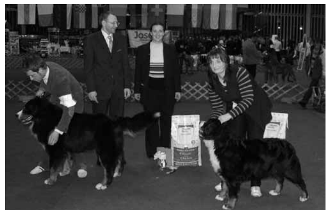
Zmagovalci razstave 14.1. 2006 v Ljubljani